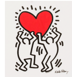
Cheval de la Grotte de Lascaux_– 15 000 av. JC Banksy – Soldat peignant la paix – Cœur de Keith Haring

Cette façon de s'exprimer depuis les grottes de Lascaux a perduré à travers les siècles pour donner naissance au street art. Les artistes Banksy et Keith Haring peignent sur les murs pour les décorer mais aussi pour défendre la paix dans le monde.