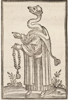
Gravure - XVIème siècle

A la fin du Moyen-âge, de nombreux chrétiens perdent confiance en l'Église. Ils pensent que certains évêques vivent dans le luxe comme des seigneurs alors que le peuple est malade, subit la famine et les guerres.