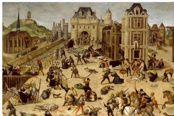
Massacre de la Saint-Barthélemy