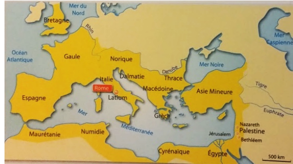
Carte de L'Empire romain au temps de Jésus-Christ